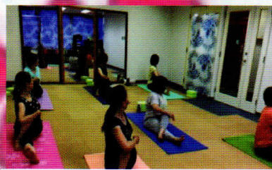
《スタンダードクラス》 皆さん、楽しみながら真剣です

無理はさせません。いつの間にか無理だった動きができるように！いつの間にか身体も柔らか