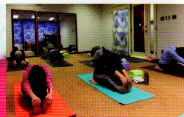
《シニアクラス》 はじめは皆さん、ガチガチでした

鍼灸接骨院との併設の為、患者さんが生徒さんとして通われている方も多くいらっしゃいます。